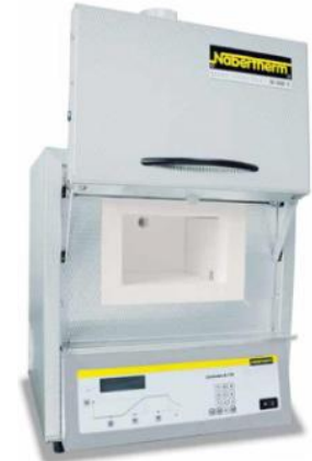
Asche- und Flüchtigengehalt